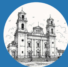
Basilica Nuestra Señora del Rosario Chiquinquirá - Boyacá

La espiritualidad mariana dominicana, arraigada en la experiencia contemplativa de Santo Domingo de Guzmán y de los primeros frailes, ha reconocido siempre en la Virgen María a la compañera inseparable del predicador y a la Maestra de la Palabra encarnada. Desde esta conciencia nació la devoción al Santo Rosario, auténtico compendio del